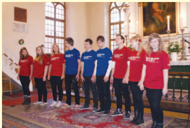
November 17-én az áhítat keretében fellépett a norvég TEN SING együttes, amely a békéscsabai Keresztyén Ifjúsági Egyesület vendégeként tartózkodott városunkban.