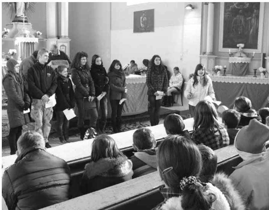
A gimnazisták műsorában adventi versek és énekek mellett előadás hangzott el Szent Miklós püspökről is.